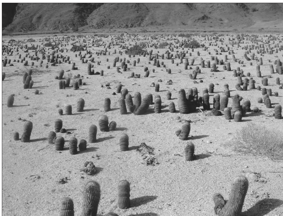
Polopoušť v okolí Esmeraldy.