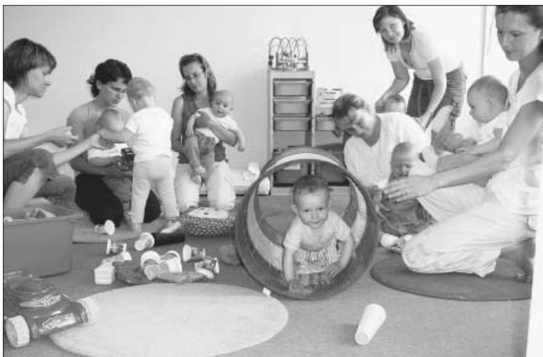
Hrátky s nejmenšími.

Ve středu od 9 do 11 hod. Mimiklub pro děti od 6 měsíců do 1 roku.