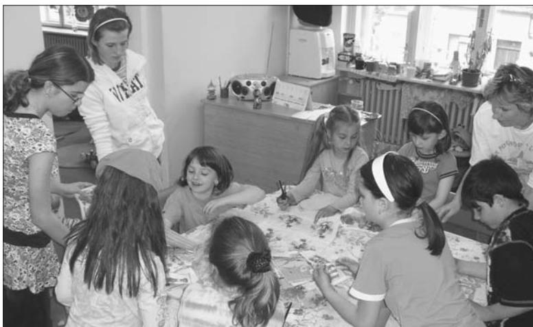
V místnosti pro starší děti jsou vždy všechny stoly zaplněny v době tvořivých dílniček.